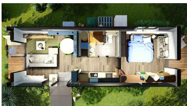
VARIANTA OPEN – s přímým vstupem

Dispozice - v základních dvou provedeních