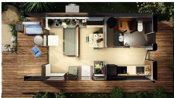
VARIANTA OPEN – s předsazením a větším prosklením

Dispozice – v základních dvou provedeních