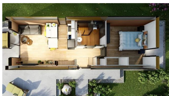
VARIANTA LIVING – s chodbou