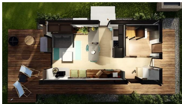
VARIANTA LIVING – více prostoru pro život a větší soukromí